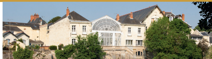
Vos réceptions d'affaires,