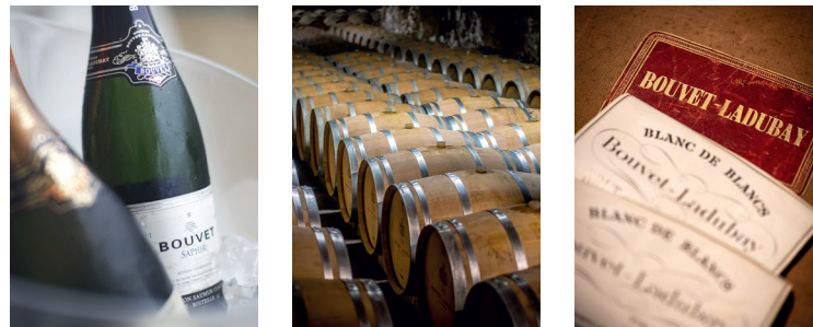
dans un cadre unique sur les bords de la Loire.