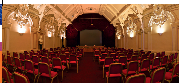
Un Théâtre 19 ème