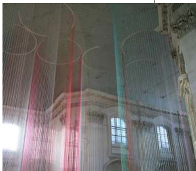
Virevoltes [Lisses], 2010, Chapelle de l'Oratoire, musée des Beaux-Arts de Nantes

Le Centre d'Art Contemporain Bouvet Ladubay présente, du 12 mai au 1 er octobre, « Rappels en parallèle », une exposition que Cécile Bart a conçue comme un parcours en couleurs et en mouvement.