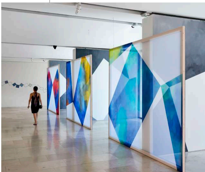
Je suis bleue, 2021, musée Marc Chagall, Nice