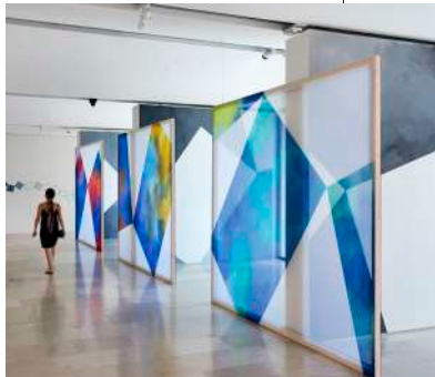
Je suis bleue, 2021, musée Marc Chagall, Nice